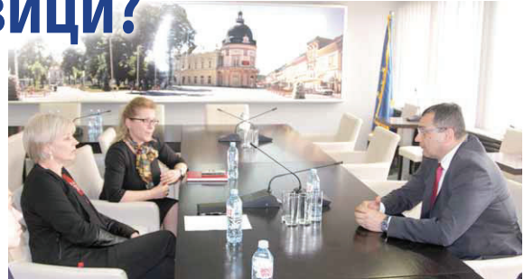
Разговор у Градској кући

Секретар је напоменуо да сарадња са Високим школом већ постоји, те да ће покрај-